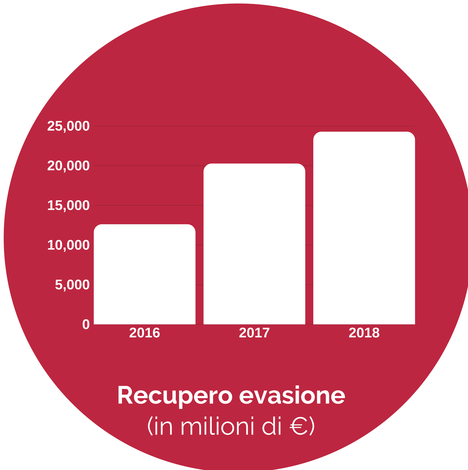
Recupero evasione (in milioni di €)