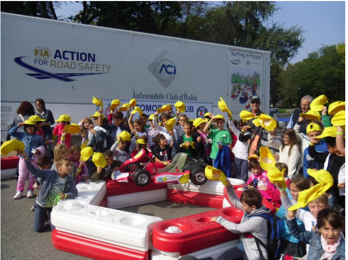
Il pilota Dindo Capello circondato da bambini entusiasti (Torino 2014)