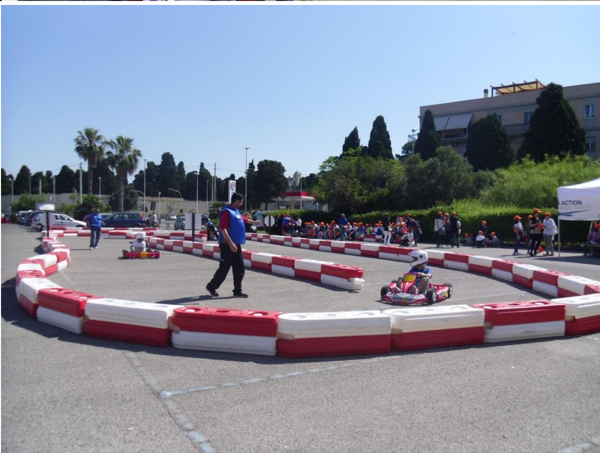
I tracciati allestiti in spazi di diversa tipologia (Cagliari e Nuoro 2014)