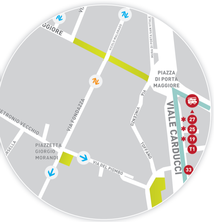
Vicino ai viali