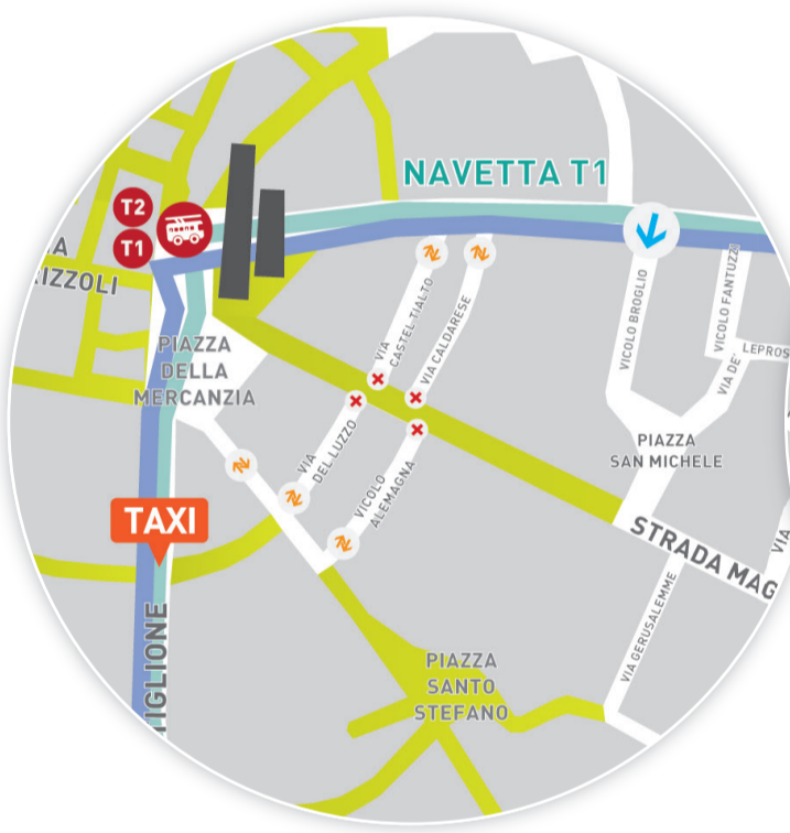
Sotto le torri