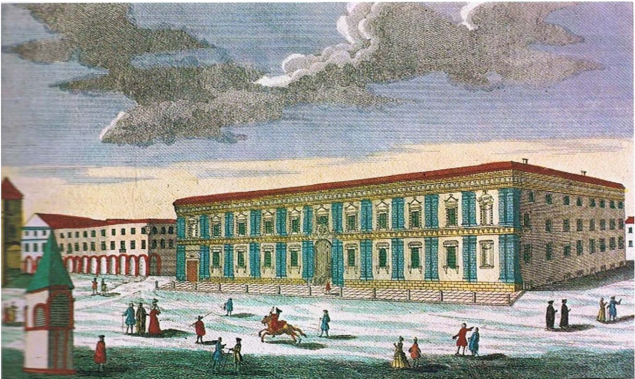
Via San Vitale con palazzo Fantuzzi e la cappella della croce di S. Vitale (Incisione F. B. Werner, 1732)