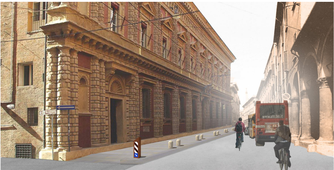
Fotoinserimento della nuova area pedonale - vista via S.Vitale