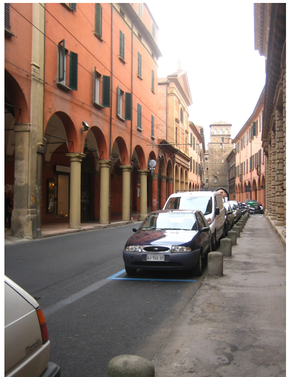
Stato attuale della facciata e sua area prospiciente