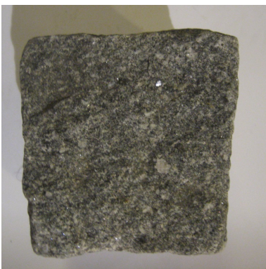
Pietra diorite per pavimentazione attraversamento stradale