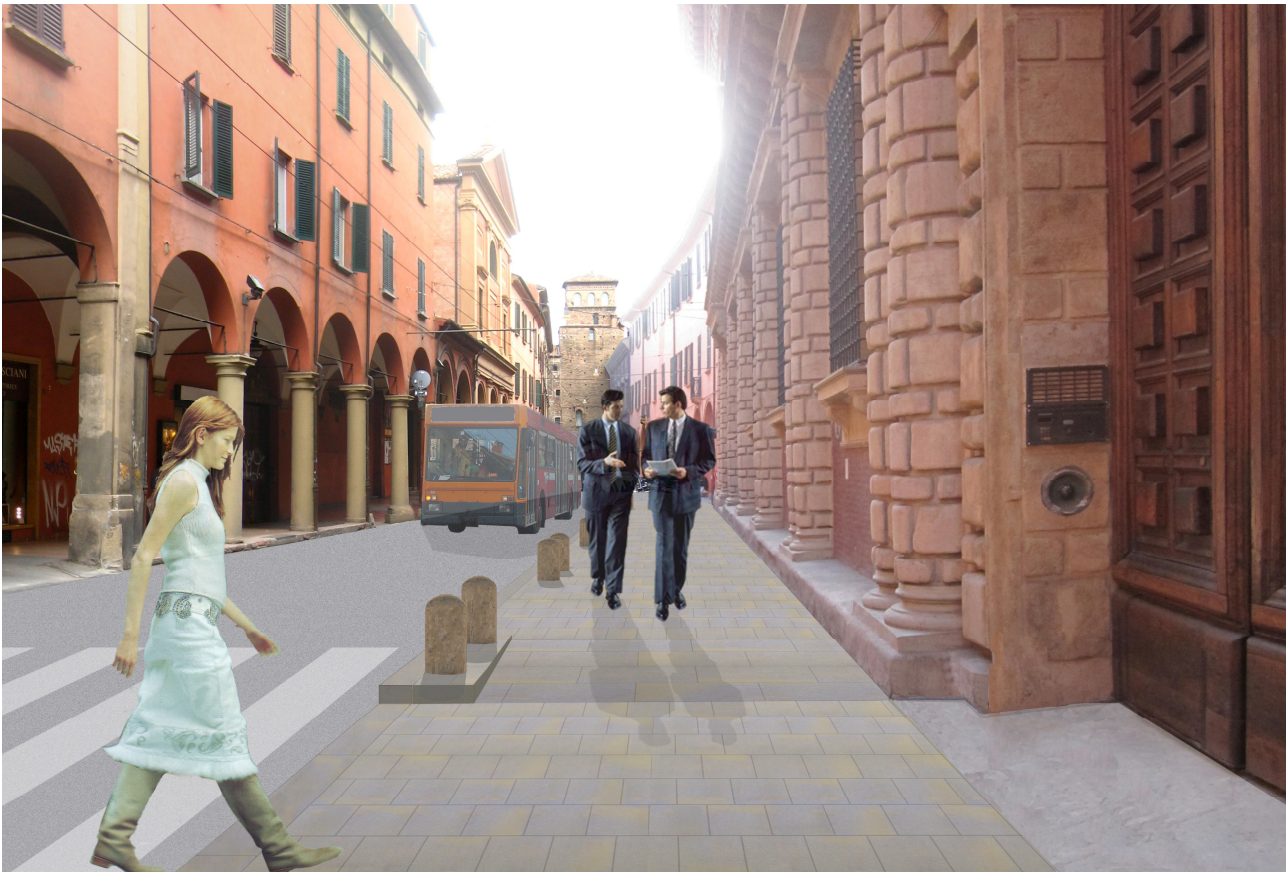
Fotoinserimento della nuova area pedonale - vista via S.Vitale