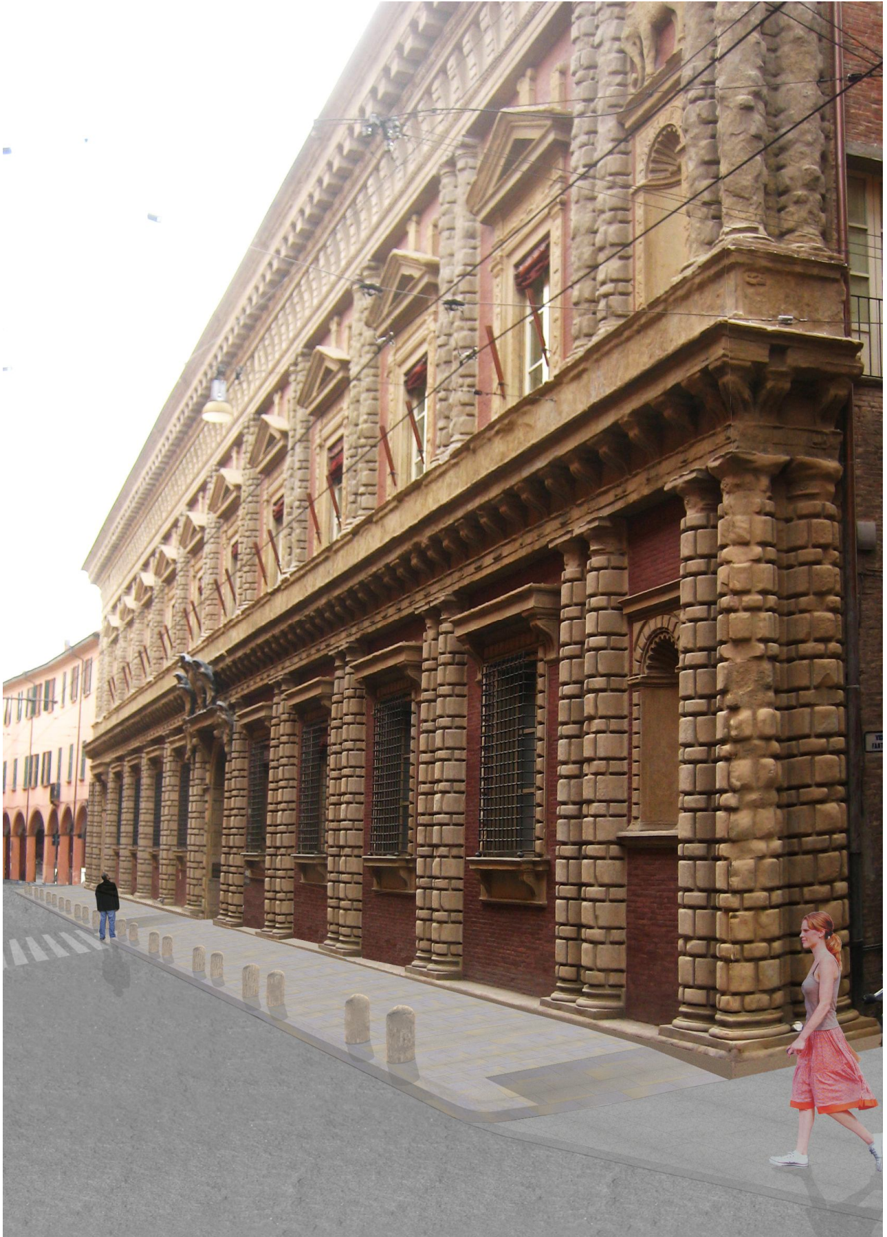
Fotoinserimento della nuova area pedonale - vista via S.Vitale