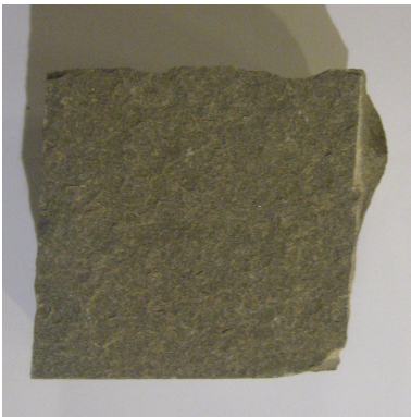
Pietra arenaria grigia per la pavimentazione (esposta agli agenti atmosferici per 2 anni)