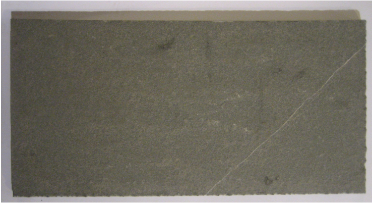
Pietra arenaria grigia per la pavimentazione( momento della posa in opera)